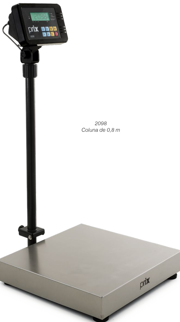
2098 Coluna de 0,8 m