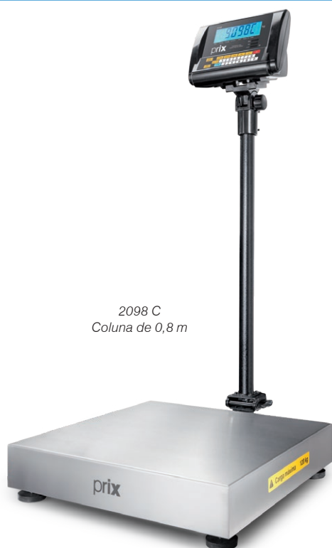
2098 C Coluna de 0,8 m