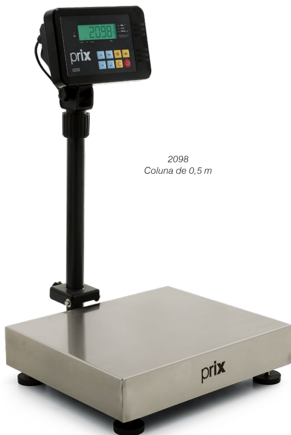
2098 Coluna de 0,5 m

Proporciona quatro níveis de filtro, permitindo adequar a balança às condições do local de instalação que possam interferir no tempo de estabilização da indicação de peso (vibrações ou correntes de ar).