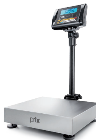
2098 C Coluna de 0,5 m

Possui barramento gráfico auxiliar no display, com setas acima e abaixo, para facilitar o monitoramento das faixas de tolerância dos produtos que estão sendo verificados. Permite configurar as tolerâncias máximas, inferior e superior do peso, determinando a faixa aceitável das pesagens.