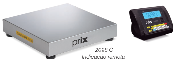
2098 C Indicação remota

Permite realizar contagens por amostragem ou peso médio por peça.